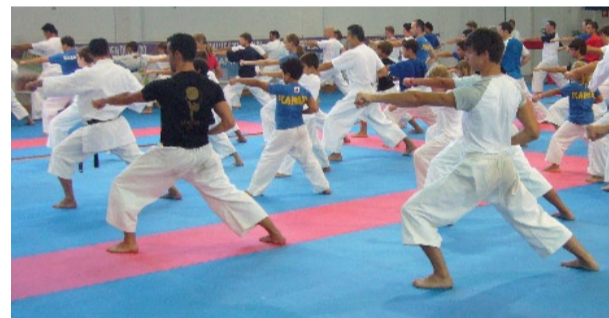
Una fase degli allenamenti di Kata