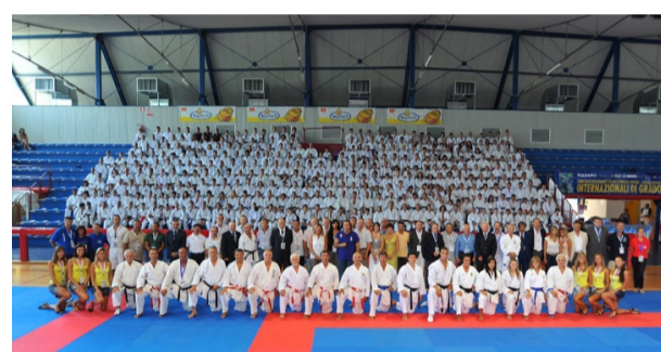
Oltre 1000 i partecipanti allo Stage di Grado