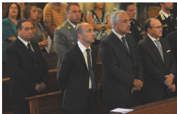
Autorità civili e militari presenti in Cattedrale

Per ricordare la figura del magistrato Antonino Scopelliti, si è svolto, a Piazza Duomo di Reggio Calabria in due intense giornate, il meeting nazionale antimafia. Nella prima serata don Luigi Ciotti ha officiato una Santa Messa nella Cattedrale, alla presenza di autorità civili e militari oltre ad un folto pubblico, in commemorazione del giudice Scopelliti assassinato il 9 agosto 1991 lungo la strada che porta a Campo Calabro. Successivamente dopo la proiezione di alcuni brevi filmati dell'epoca, sul palco allestito in Piazza Duomo, si è svolto un'interessante tavola rotonda moderata dal giornalista della Rai Lamberto Sposini cui hanno preso parte Rosanna Scopelliti, figlia del magistrato e presidente dell'omonima Fondazione, il console generale degli Stati Uniti Patrick Truhn, il giornalista Antonio Prestifilippo, il vicecapo della Polizia Nicola Izzo, il magi-