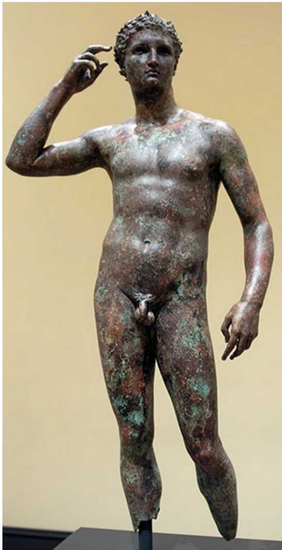
Il giovane giavellottista greco

Per 45 anni lo hanno chiamato "Il giovane che si incorona" Alla ricerca dell'identità perduta E' un Atleta greco che maneggia due giavellotti prima di una gara