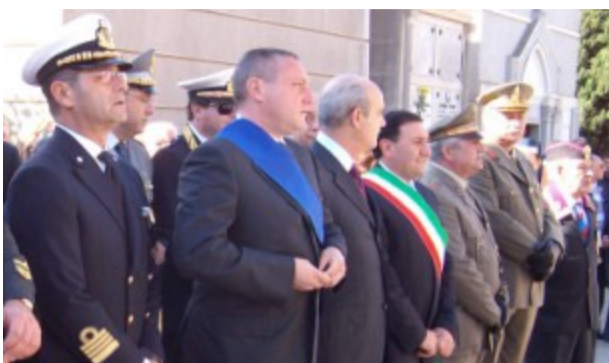
Autorità civili, religiose e militari

Il 2 novembre ha avuto luogo presso i cimiteri di Condera ed Archi la commemorazione dei Caduti per la Patria alla presenza di Autorità civili, religiose, militari ed associazioni combattentistiche e d'arma. A Condera dopo la Santa Messa officiata da S.E. l' Arcivescovo Metropolitano Vittorio Mondello è stata deposta una corona di alloro al Sacratio dei Caduti a cura del comandante della Direzione Marittima di Reggio Calabria con la partecipazione di S. E. il Prefetto di Reggio Calabria Francesco Musolino; successivamente in ricordo dei militari dell' esercito deceduti durante il terremoto del 1908 nella Caserma Mezzacapo è stata deposta una composizione di fiori nel monumento a loro dedicato. La seconda