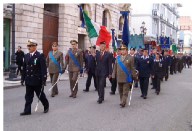
Sfilata delle Associazioni Combattentistiche e d'Arma

relativo alle missioni internazionali. Per la provincia di Reggio Calabria nel periodo dal 4 all' 8 novembre 2009 all' iniziativa delle "caserme aperte" sono state coinvolte la Scuola Allievi Carabinieri di Reggio Calabria, la Direzione Marittima di Reggio Calabria, la Capitaneria di Porto di Gioia Tauro, l'Ufficio Circondariale Marittimo di Roccella Jonica, il Comando Compagnia Carabinieri di Bianco e di Roccella Jonica. Per il secondo anno consecutivo Reggio Calabria è stata designata tra le venti città in cui l'8 novembre si è svolta la cerimonia conclusiva delle celebrazioni per la Festa dell'Unità Nazionale e per la Giornata delle Forze Armate. Alle 9.45 cerimonia dell' Alzabandiera: reparto interforze in armi e concerto della banda della Brigata "Aosta" all' Arena Ciccio Franco; esposizione di mezzi e materiali in dotazione alle Forze Armate nelle Piazze Duomo ed Indipendenza e sul Corso Garibaldi, mostra fotografica sul tema delle missioni internazionali al teatro Comunale. A Piazza indipendenza ed Arena Ciccio Franco atti dimostrativi dell' Esercito italiano, dell' Arma dei Carabinieri e della Guardia di Finanza. Alle ore 16 un secondo concerto della Banda ed alle ore 17.00 la cerimonia dell' ammainabandiera. Un intenso e ben articolato programma che mette