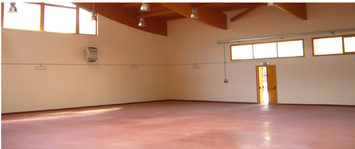
La Palestra di Judo, Lotta e Karate chiusa da oltre due anni