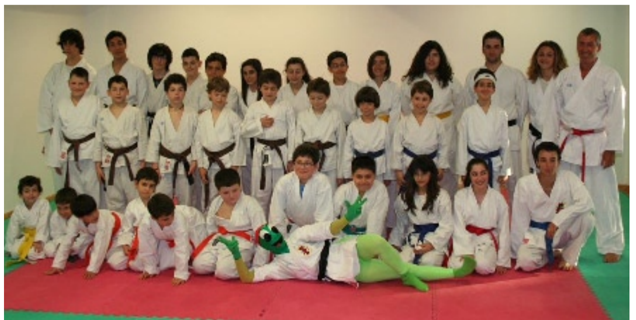
Il "Gruppo Sportivo" della S.G.S. Fortitudo 1903