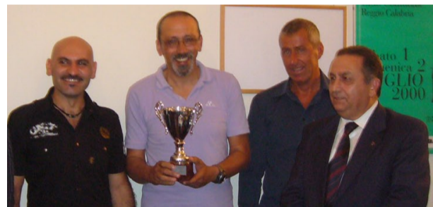
La Squadra "Maschile" di Tiro "U.N.U.C.I.