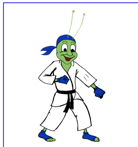
Parata bassa (GEDAN BARAI)