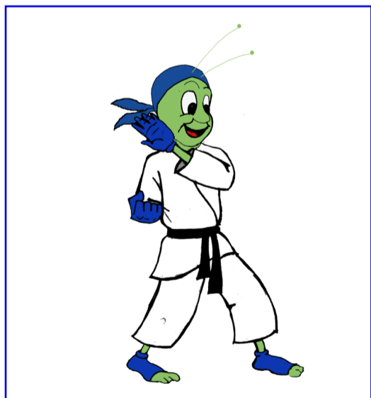
Parata verso l'interno (SOTO UKE)