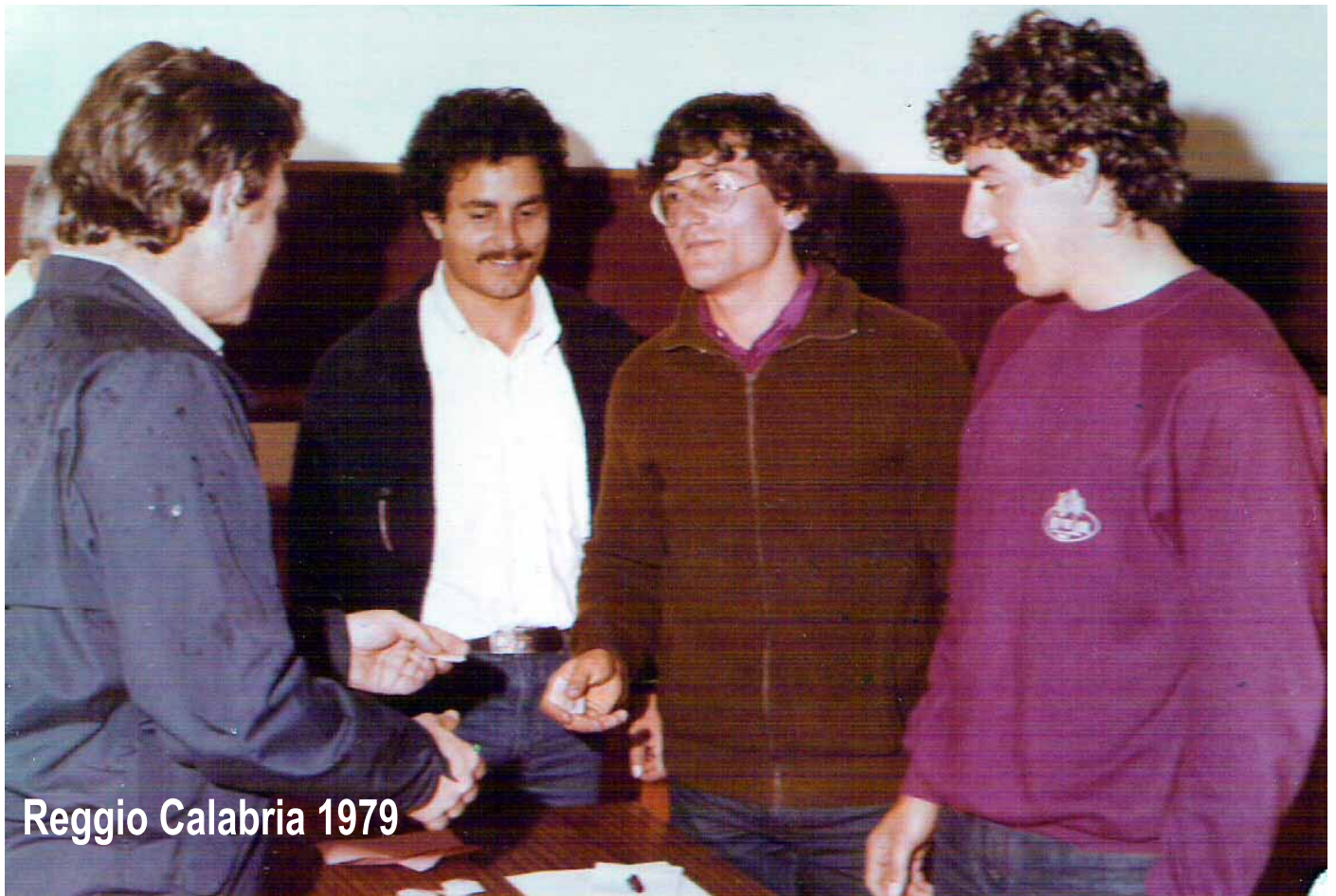
Reggio Calabria 1979