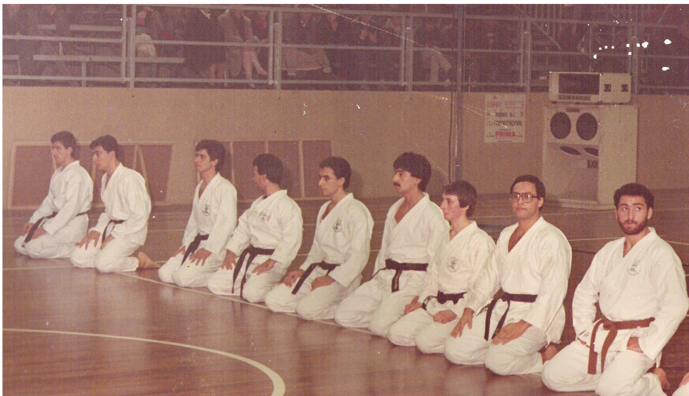
Partinico, Mangiola, Panella, Poto, Stillittano, Praticò, La Camera, Altavilla, Barreca