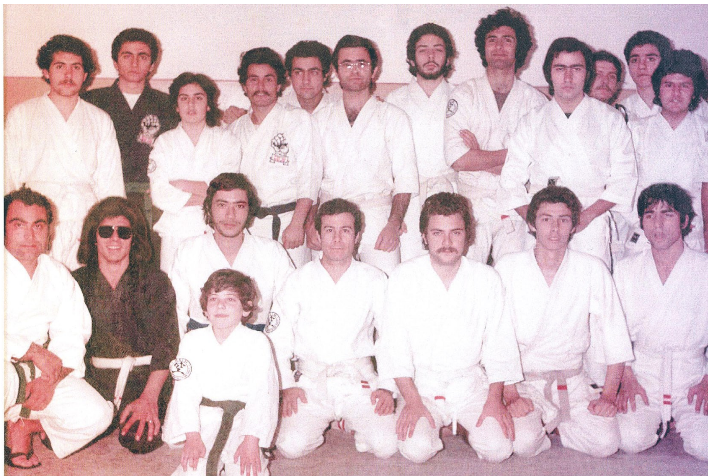
1974 - "BUSHIDO KARATE" - Foto di gruppo