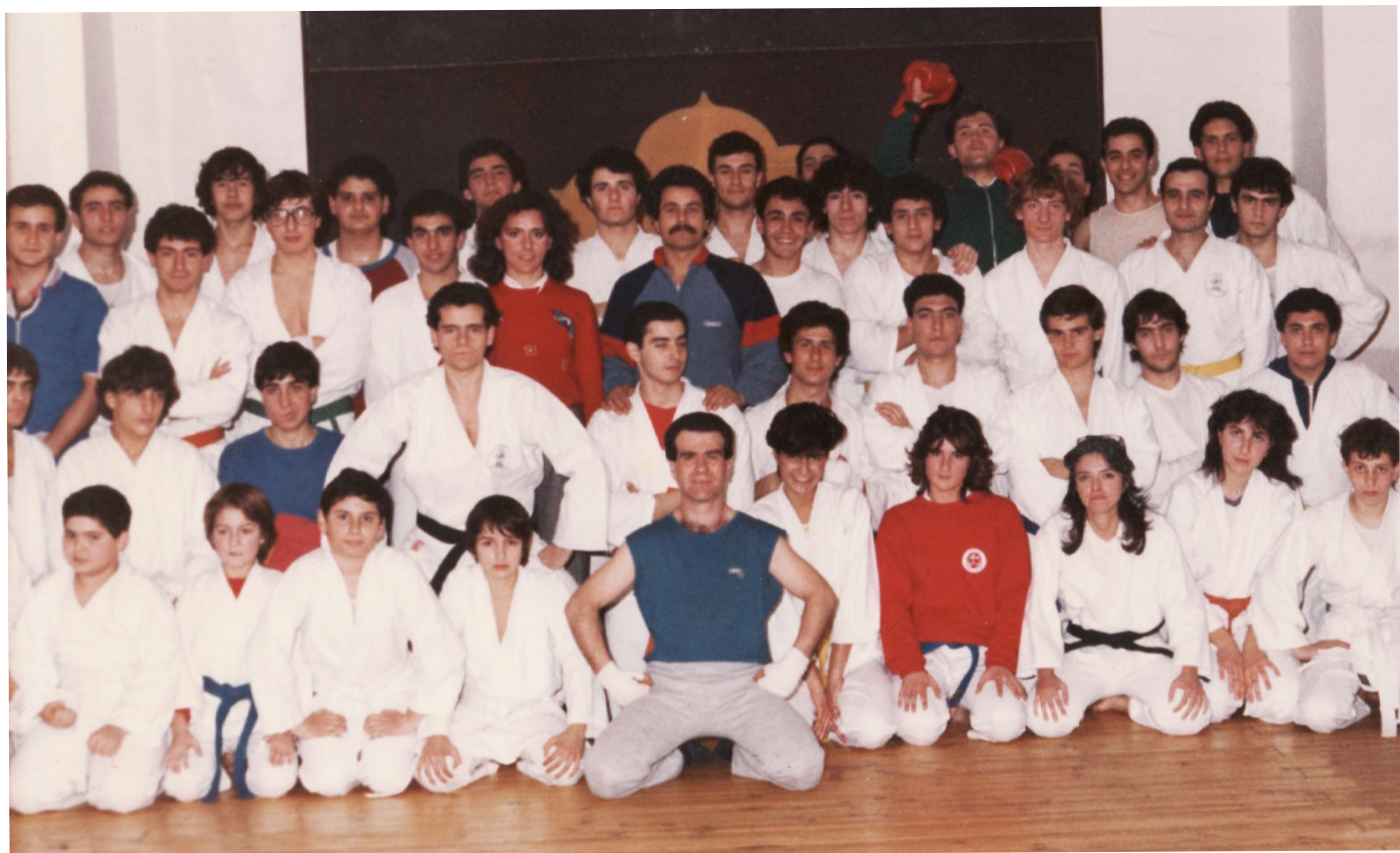
Una foto di gruppo della Bushido Karate nell'anno 1982